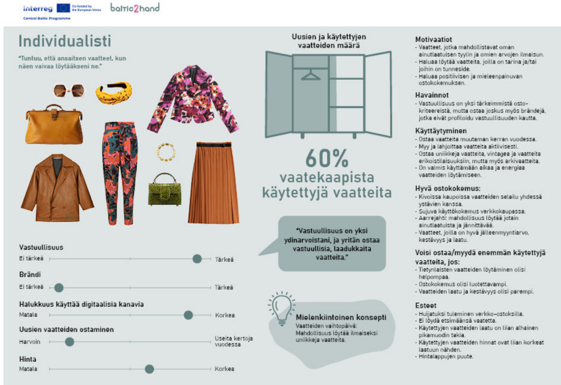
Kuva 2. Persoonakortti Persoonallinen pukeutuja.

Persoonalliselle pukeutujalle (kuva 2) ekologisuus on tärkeä arvo, joka ohjaa hänen kulutuspäätöksiään vaatekaupoillakin. Hän onkin tottunut secondhand-tekstiilien kuluttaja, jolle itseilmaisu vaatteiden kautta on tärkeää ja jolle ostotapahtuma secondhand-maailmassa on usein jännittävä sosiaalinen elämys. Hän voisi ostaa ja myydä secondhand-tekstiilejä vieläkin enemmän, jos juuri tiettyjen tuotteiden löytäminen olisi nykyistä helpompaa.