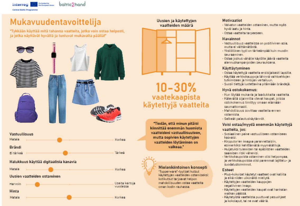
Kuva 4. Persoonakortti Mukavuudentavoittelija.

Mukavuudentavoittelija (kuva 4) tietää kyllä, että ekologisuus on tärkeää ja secondhand vaatteita "pitäisi" ostaa enemmän. Käytännössä hän kuitenkin painottaa usein ostamisen helppoutta ja päätyy siksi ostamaan vaatteita uusina osin myös hyvän hinta-laatusuhteen vuoksi. Uusia vaatteita ostamalla välttyy myös oikean koon etsimisen tuskailuilta. Lapsilleen hän ostaa useammin secondhand-vaatteita. Hänen tulisi ostettua secondhand-vaatteita enemmän, jos sopivia kauppia olisi lähempänä ja jos online-ostosten teko helpompaa.