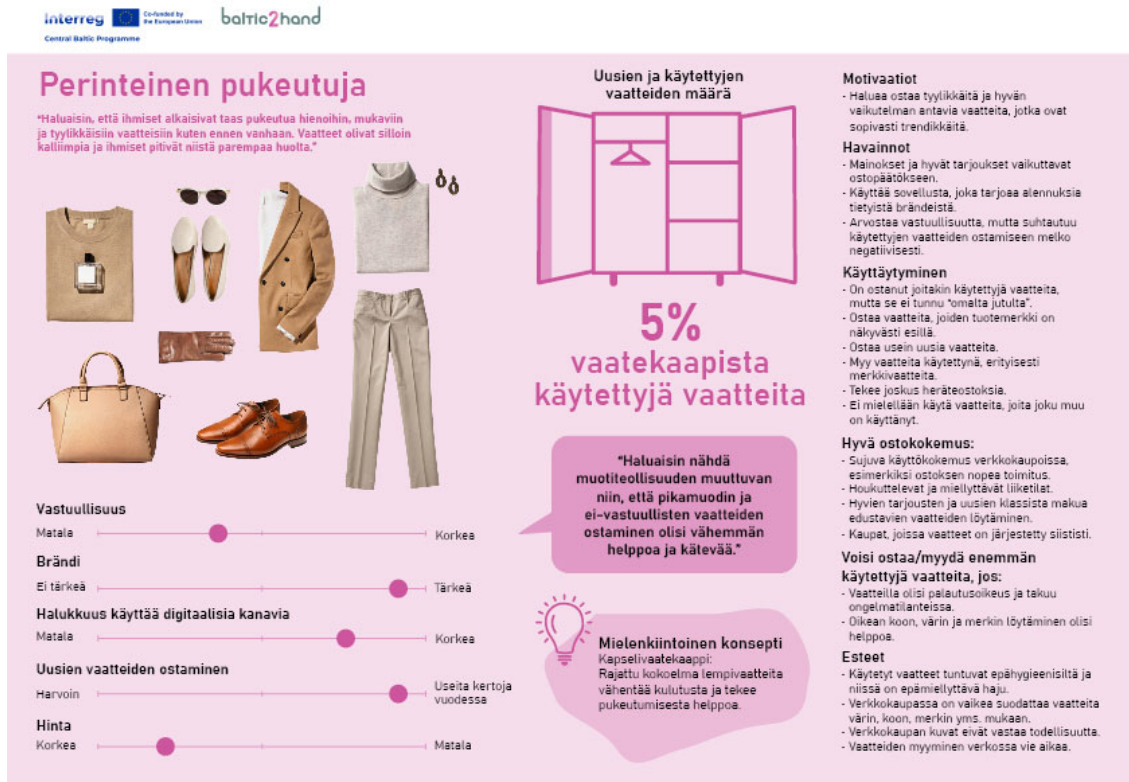
Kuva 3. Persoonakortti Klassinen pukeutuja.

Klassinen pukeutuja (kuva 3) arvostaa tiettyjä brändejä ja ajatonta tyyliä. Secondhand- vaatteita hän ei juurikaan käytä, sillä niihin liittyy mielikuva ikävästä hajusta ja hygienian puutteesta eikä ajatus siitä, että käyttää muiden vanhoja vaatteita houkuta. Hän arvostaa ekologisuutta, mutta se ei johda juuri käytännön tekoihin. Toisaalta Klassinen pukeutuja pitää huolta vaatteistaan ja ihannoi minimalistista vaatekaappia, jonka kaikki elementit sopivat yhteen. Hän saattaisi ostaa enemmän secondhand-vaatteita, jos niiden palauttaminen olisi helpompaa.